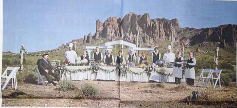
Le collectif Einzwelndrei, «Vies de la vie», 2012. Une installation en extérieur, composée de centaines de petites formes arrondies, empilées les unes sur les autres.