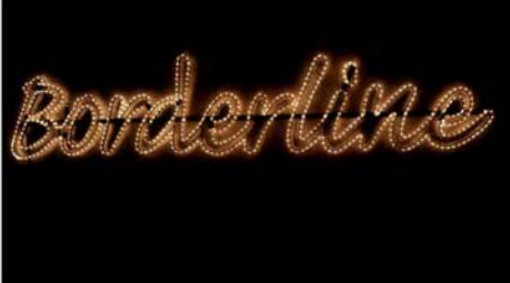
Bordenline. 2007. LED. Jeanne susplugas