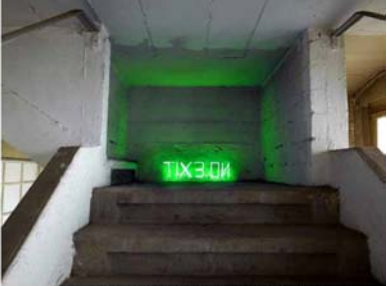
Untitled, 2012, neon (simulation)

Jonathan Monk pratique tant l'installation que le dessin ou la vidéo. A travers l'humour, la dévotion et l'appropriation d'œuvres existantes, Jonathan Monk démystifie les processus artistiques et interroge la place de l'artiste dans la société. Il a exposé dans de nombreuses institutions tels le MOMA de New York, le Centre Pompidou à Paris ou encore le Musée d'Art Contemporain de Barcelone. Ses pièces sont aussi présentées dans de grandes collections comme la Solomon Guggenheim ou encore la Tate Britain à Londres. Né en 1969 à Leicester (Royaume-Uni). Vit et travaille à Berlin.