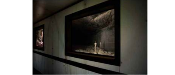
The Apocalypse Figures I, 2012. Tirages argentiques sur aluminium.