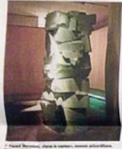
Leo Piretti, «Vies de la vie», 2012. Une sculpture en résine verte, composée de centaines de petites formes arrondies, empilées les unes sur les autres.