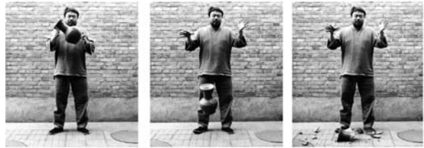
Dropping a Han Dynasty Urn. 1995. Trois tirages argentiques. Ai Weiwei

Considered one of today's most influential artists, Ai Weiwei ceaselessly observes and questions our societies, and in particular social conditions in China. He was arrested and kept in a secret location for some months in 2011 by the Chinese government and has since been banned from leaving the country. His work takes the form of sculpture, photography, architecture, as well as tweets on Twitter and blogs. He exhibited at the 48th Venice Biennial and of the Documenta XI in Kassel, as well as of the Unliver Series exhibition at the Tate Modern with his piece Sunflower Seeds. He was also the subject of an extensive retrospective show of the Jeu de Paume in Paris. Born in Beijing in 1957. Lives and works in Beijing.