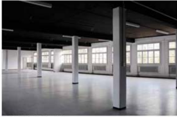
© ... Erabweideli / Apo-calypse 2012

Centrée sur le thème de l'Apocalypse, cette exposition pluridisciplinaire organisée par le Collectif Erabweideli nous présente dans les anciens locaux Béard à Clarens des sculptures, vidéos, objets, dessins et installations créées par des figures majeures de la scène contemporaine internationale ainsi que par de jeunes artistes suisses. Diverses lectures, performances et films agenceront l'exposition.