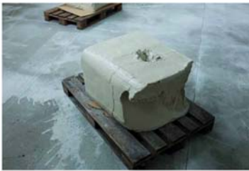
Erwin Wurm. Zamkulukun. Big bear and leaf (I). 2011. Matière: bronze. Hauteur: 45 x 47 x 70 cm.