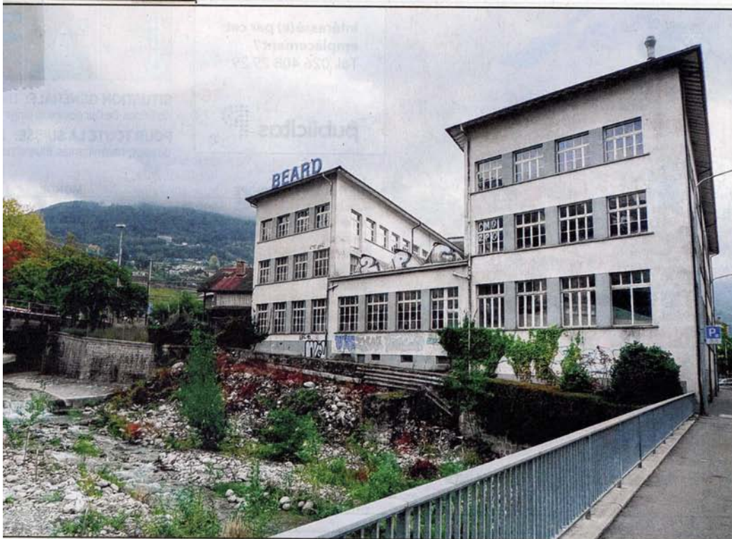
L'usine Béard abrite jusqu'au 21 décembre trente œuvres originales ou jamais montrées en Suisse. EINZWEIDREI/APO-CALYPSE 2012