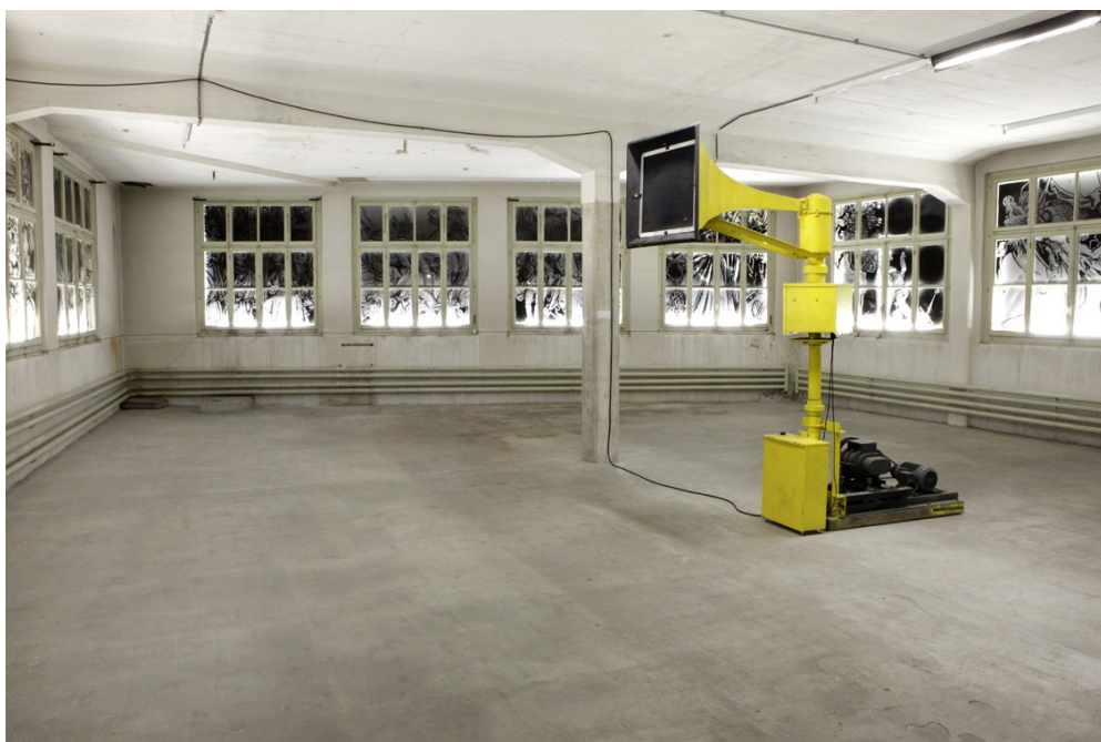
Julius von Bismarck, Der Schrei , 2012, production Einzweidrei, courtesy Alexander Levy, Berlin